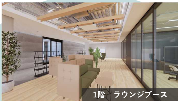
1階 ラウンジブース