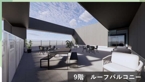
9階 ルーフバルコニー