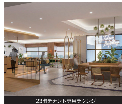
23階テナント専用ラウンジ

所在地 / 東京都港区台場二丁目3番1号 交通 / ゆりかもめ「お台場海浜公園」駅、 りんかい線「東京テレポート」駅から徒歩3分 構造・規模 / 鉄骨造・一部鉄骨鉄筋コンクリート造、 地下2階、地上23階 延床面積 / 76,925.18㎡ 設計管理 / 日建設計 施工 / 清水・大成・大林共同企業体 エレベーター / 乗用16基、貨物3基 空調設備 / セントラル空調(各階4分割にゾーニング) 開閉館時間 / 平日7:00~19:30 管理形態 / 24時間有人管理 夜間入退館方法 / カードによる入退館 駐車場 / 自走式39台、機械式140台 駐車場営業時間 / 24時間入出庫可